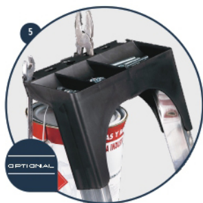
5 Bandeja para herramientas Tooltray Porte-outils Porta ferramentas