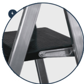
4 Bielas de acero galvanizado Crank made of galvanised steel Bielles en acier galvanisé Bielas de aço galvanizado