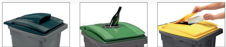
Tapa para papel Tapa para envases Tapa para varios