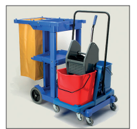
Ejemplo de 8074 con Carlimp STAR