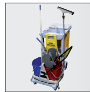
Ejemplo de 8076 con Carlimp 2000