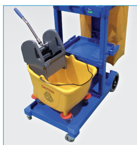
Cubo con prensa opcional "Thor"