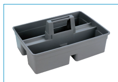
Opcional: Cubeta para accesorios