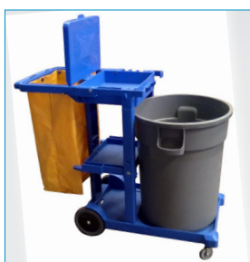
Contenedor opcional "Tauro"