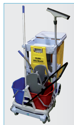
Ejemplo de configuración