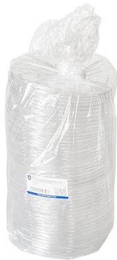
Imagen de paquete

215.04 ENSALADERAS 224.32 ENSALADERAS 231.25 ENSALADERAS 231.26 ENSALADERAS