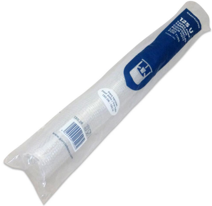
Imagen de paquete