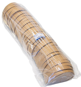
Imagen de paquete

212.98 ENSALADERAS 212.99 ENSALADERAS 226.31 ENSALADERAS 226.32 ENSALADERAS 226.35 ENSALADERAS 226.36 ENSALADERAS 226.64 ENSALADERAS