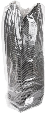
Imagen de paquete

Reglamento (CE) nº 2023/2006 de la Comisión Europea de 22 de diciembre de 2006, sobre buenas prácticas de fabricación de materiales y objetos destinados a entrar en contacto con alimentos.