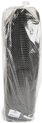
Imagen de paquete